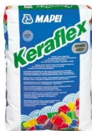
MAPEI KERAFLEX 25kg mineralno lepilo C2TE sivo 14,50 EUR/kos

APIA d.o.o., ul.25. maja 17/a, SI-5000 Nova Gorica