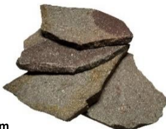
PORFIDO 1,5-3,5cm MIX SIV naravni kamen poljubne oblike 8,90 EUR/m2