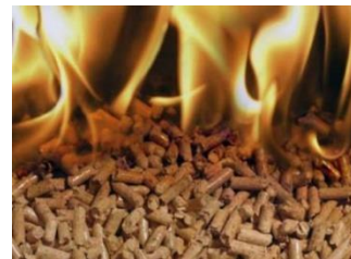
PELETI Finpelet 15kg ENplus A1 100% smreka-jelka 4,20 EUR/kos