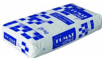
EUMAT ROFIX IA622 25kg fasadno lepilo lepilna in armirna malta 7,49 EUR/kos