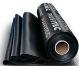
PLUVITEC EVOTEC hidroizolacijski varilni trak - V3-10m2 24,90 EUR/kos - V4-10m2 29,90 EUR/kos