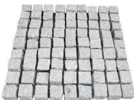
MASPE GRANIT KOCKA ŽGANA ŠTANCANI ROBOVI - cca 8x8x7cm 0,49 EUR/kos - cca 10x10x8cm 0,79 EUR/kos