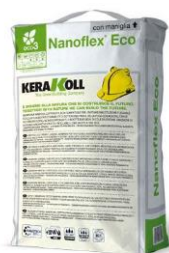
KERAKOLL AQUASTOP NANOFLEX 20kg enokomponentna EKO membrana 53,90 EUR/kos