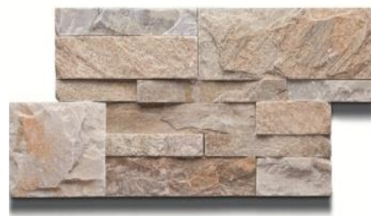
MASPE CANOVA naravni dekorativni kamen 36,90 EUR/m2