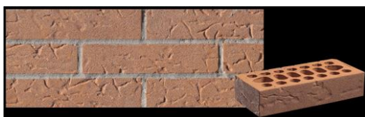
IBL ZIDAK OPEČNI rdeč rustičen 25x12x5,5cm 151N 0,39 EUR/kos