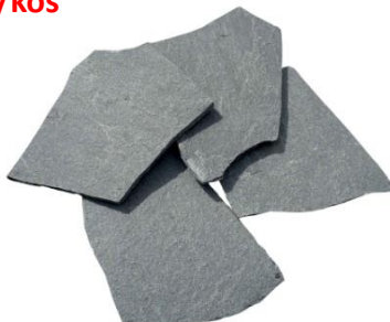
KAVALA 2-3cm SIV naravni kamen poljubne oblike 12,70 EUR/m2