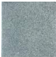
MASPE SILIGRANITI SIVA KRASS1.168/4 peskana plošča 40x40cm 2,39 EUR/kos